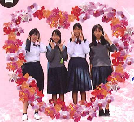
インスタ映えする洋らんの ハートアーチの登場!